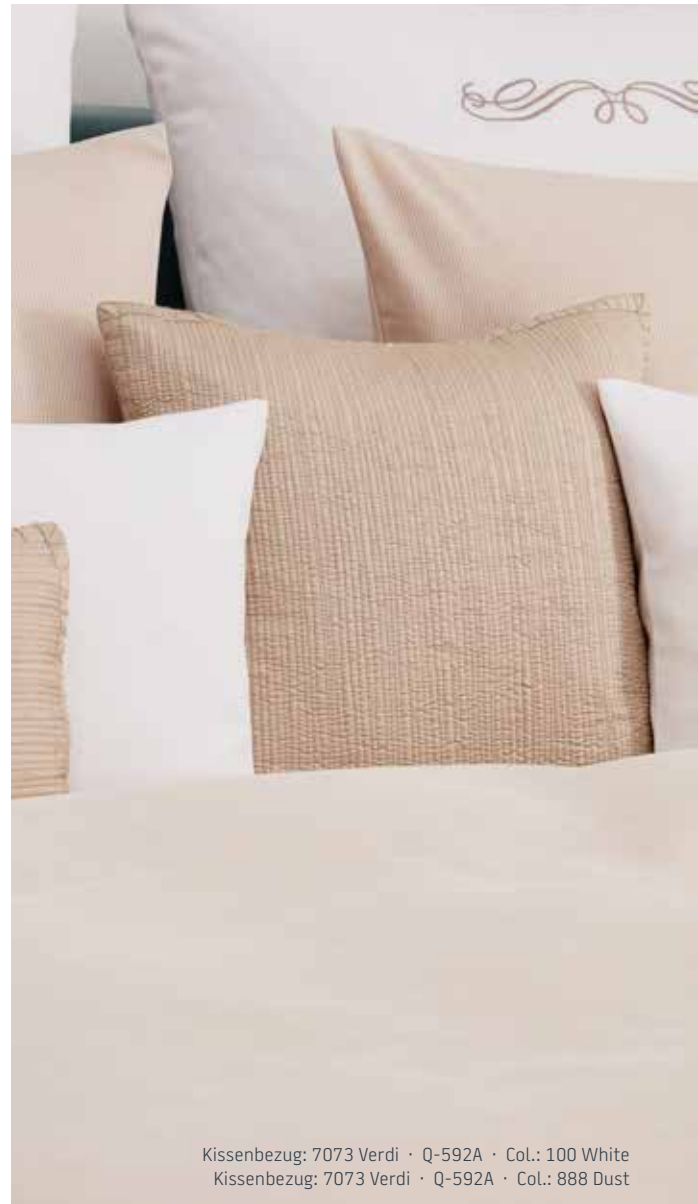
Kissenbezug: 7073 Verdi · Q-592A · Col.: 100 White Kissenbezug: 7073 Verdi · Q-592A · Col.: 888 Dust