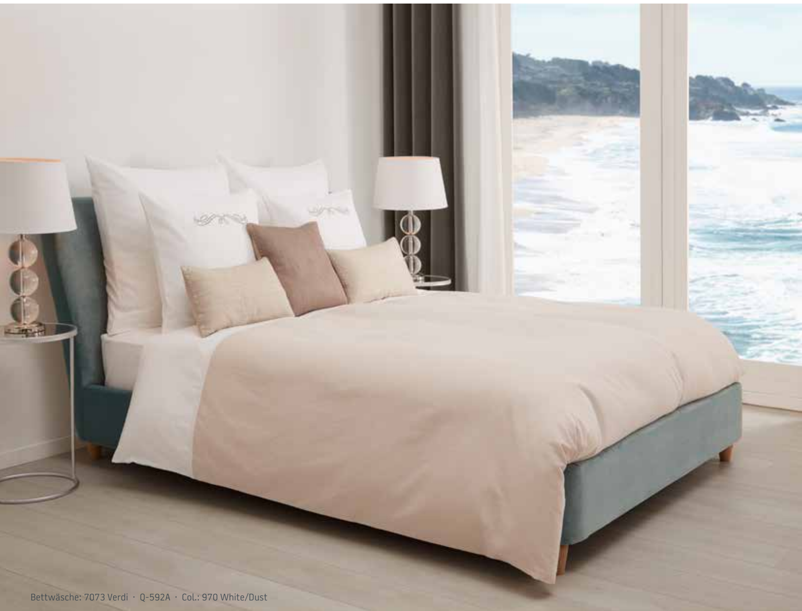
Bettwäsche: 7073 Verdi · Q-592A · Col.: 970 White/Dust