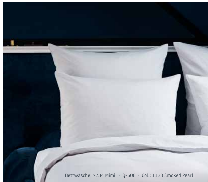
Bettwäsche: 7234 Mimii · Q-608 · Col.: 1128 Smoked Pearl