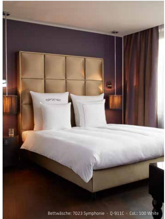
Bettwäsche: 7023 Symphonie · Q-911C · Col.: 100 White