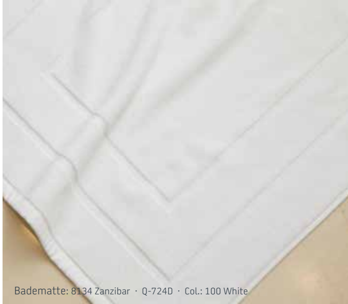
Badematte: 8134 Zanzibar · Q-724D · Col.: 100 White