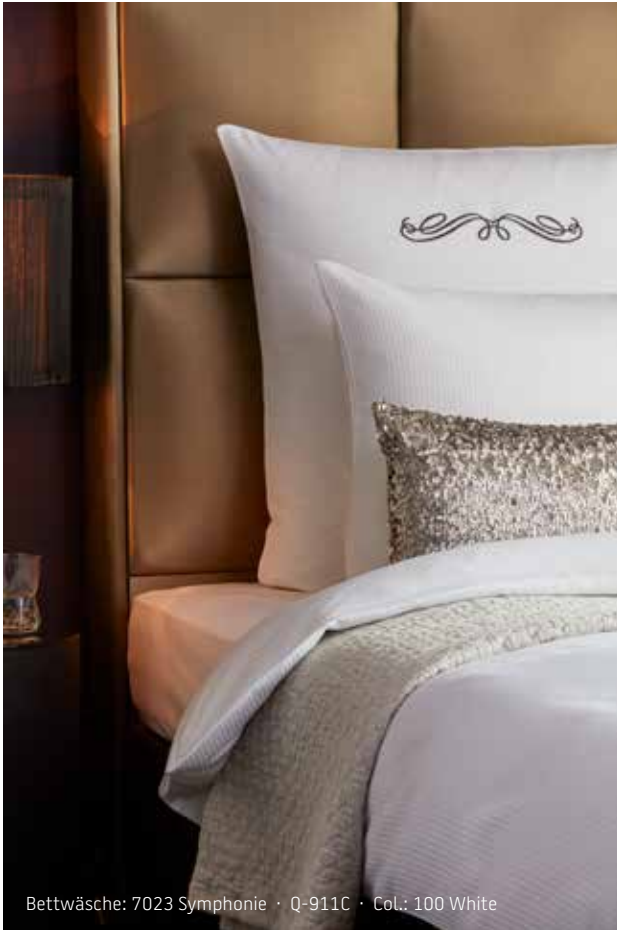
Bettwäsche: 7023 Symphonie · Q-911C · Col.: 100 White