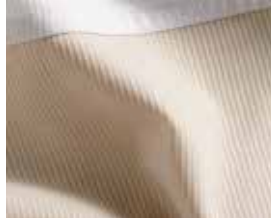
7073 Verdi Bettwäsche Col.: 970 White/Dust Q592A