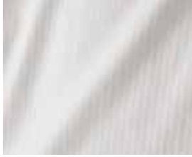
7023 Symphonie Bettwäsche Col.: 100 White Q911C