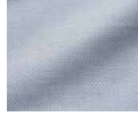
7334 Mimii Bettwäsche Col.: 1128 Smoked Pearl Q608