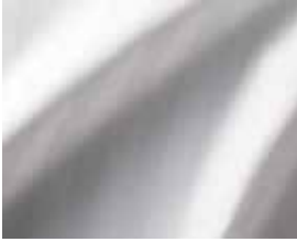
7001 Opera Bettwäsche Col.: 100 White Q911C